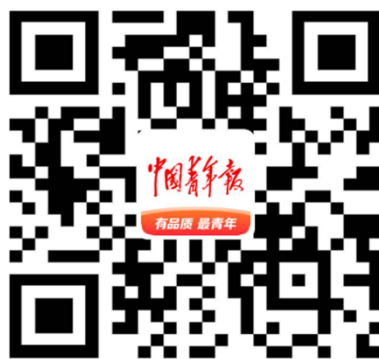
扫码下载“中国青年报”客户端