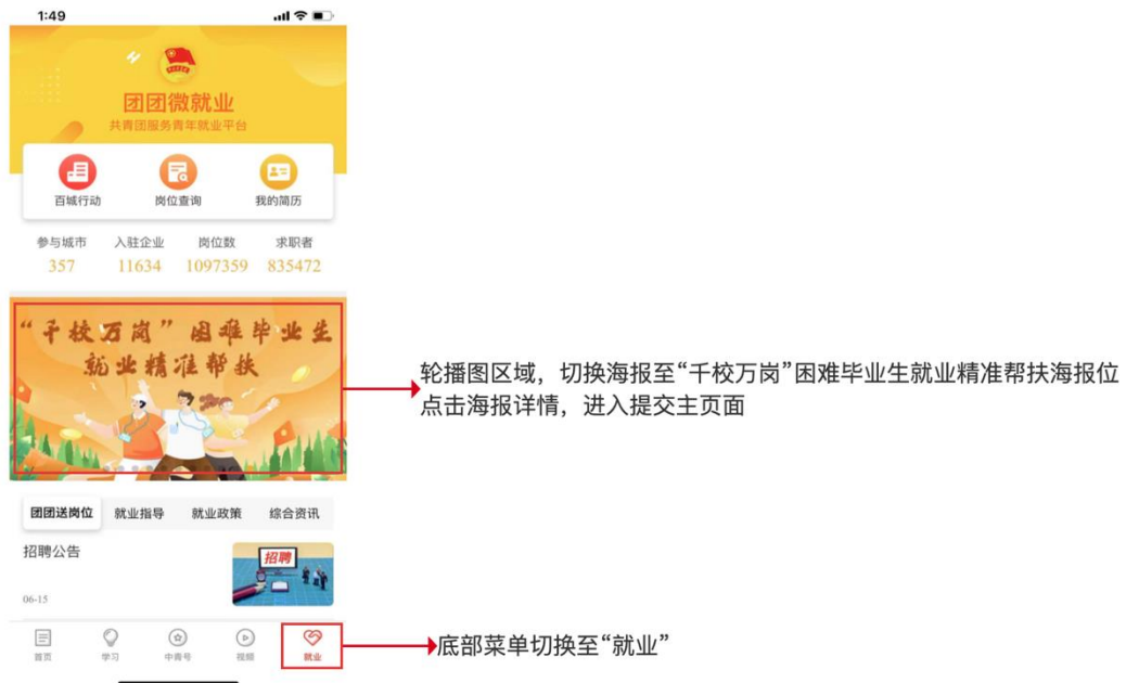
图：中青报 APP 的项目入口说明