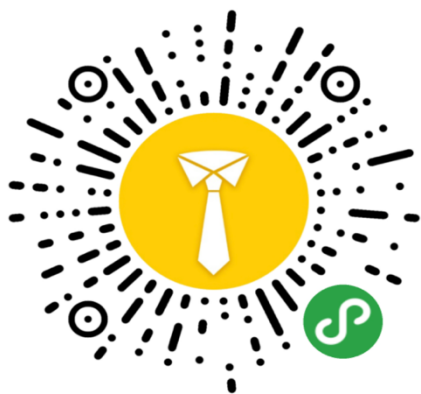
微信扫码访问“团团微就业”小程序

各高校团干部可在两个平台入口提交困难毕业生的帮扶结对名单：团团微就业小程序、中青报客户端 APP 的就业频道。访问或下载方式如下图：