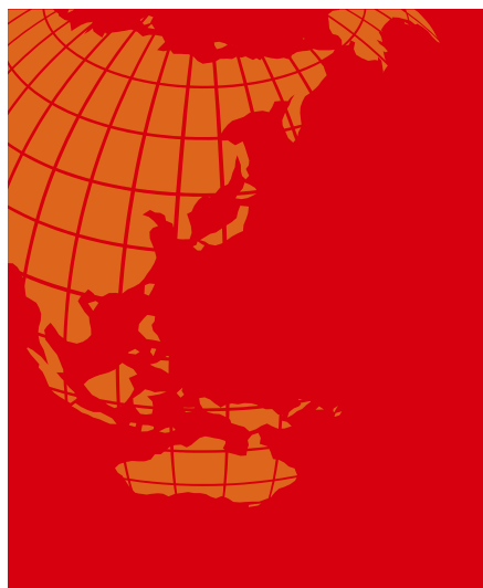
背景色: C0 M100 Y100 K10 R:215 G:0 B:15 辅助图形: C0 M70 Y90 K10 R:222 G:102 B:28