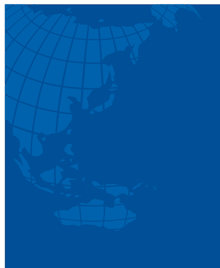
背景色: C100 M60 Y0 K20 R:0 G:78 B:151 辅助图形: C100 M50 Y0 K10 R:0 G:104 B:183