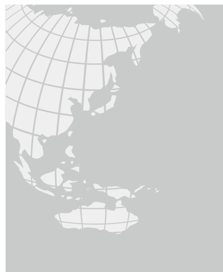
背景色: C0 M0 Y0 K30 R:201 G:202 B:202 辅助图形: C0 M0 Y0 K10 R:230 G:230 B:230